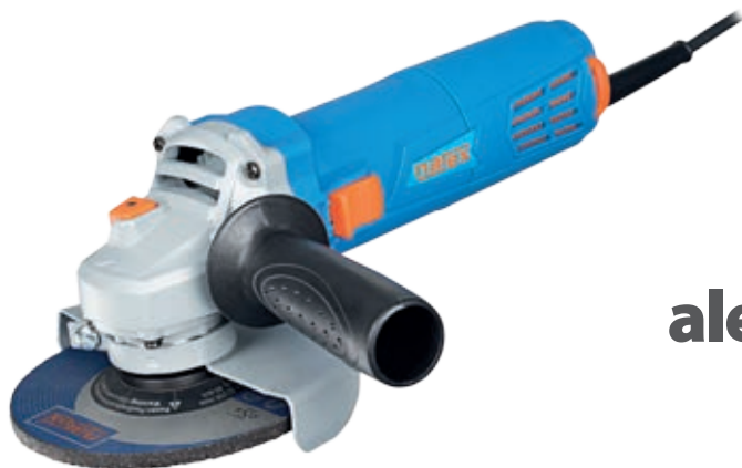
EBU 125-6 + HYBRO

Hybridný skrutkovač v hodnote 39,60 € vč. DPH