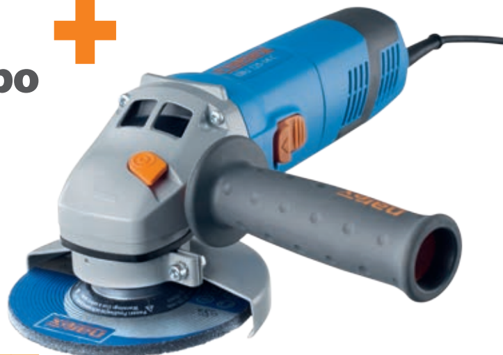
EBU 125-14 C + HYBRO

161,00 € bez DPH 193,20 € vr. DPH obj. č. setu 65 404 536