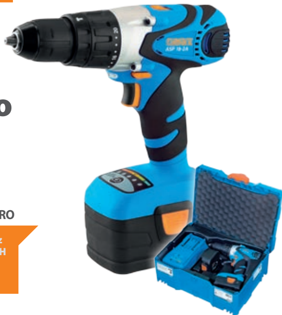
ASP 18-2A 3,0 Ah + HYBRO

268,00 € bez DPH 321,60 € vr. DPH obj. č. setu 65 404 530