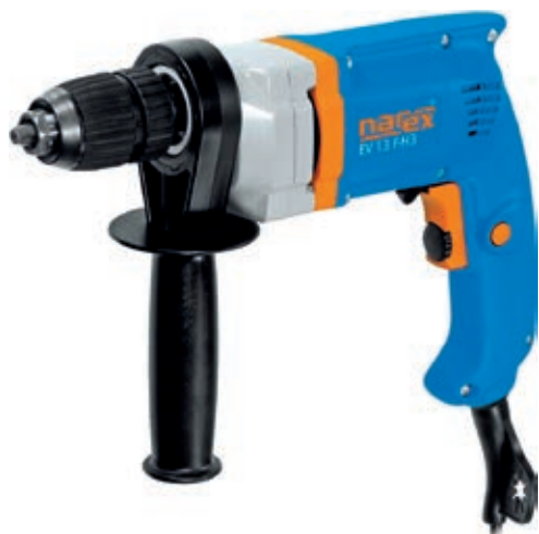
EV 13 F-H3 + HYBRO

Hybridný skrutkovač v hodnote 39,60 € vč. DPH