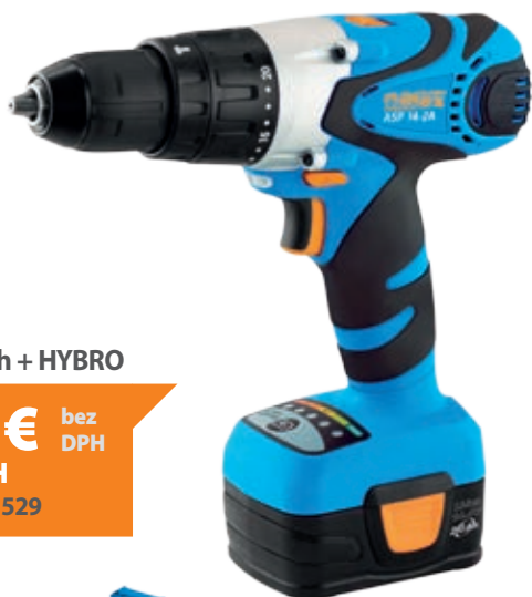
ASP 14-2A 2,0 Ah + HYBRO

242,00 € bez DPH 290,40 € vr. DPH obj. č. setu 65 404 529