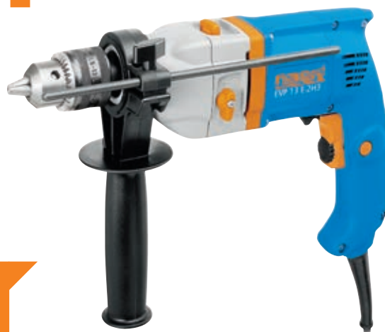
EVP 13 E-2H3 + HYBRO

122,00 € bez DPH 146,40 € vr. DPH obj. č. setu 65 404 533