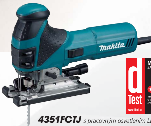
4351FCTJ s pracovným osvetlením LED priamočiara píla

Dodávané príslušenstvo: prepravný kufor systainer