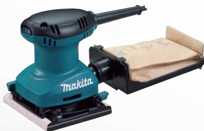
BO4557 vibračná brúska