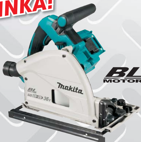
DSP600Z akumulátorová okružná píla so zanorením

Dodávané príslušenstvo: bez akumulátorov, nabíjačky a prepravného kufru