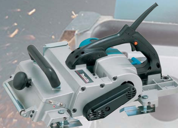
KP312S hoblík na trámy