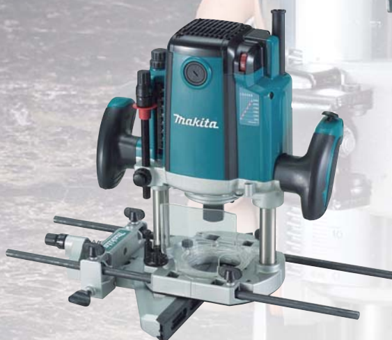
RP2300FCXJ s obmedzovačom rozbehového prúdu pre plynulý štart a pracovným osvetlením horná fréza

Dodávané príslušenstvo: prepravný kufor systainer