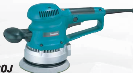
BO6030J excentrická brúska

Dodávané príslušenstvo: prepravný kufor systainer