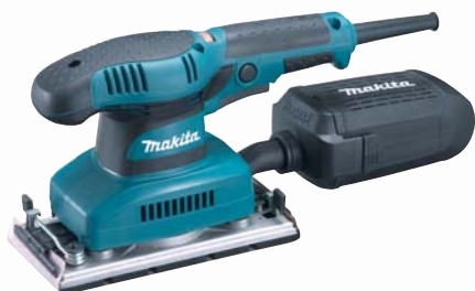
BO3711 s variabilným nastavením kmitov vibračná brúska