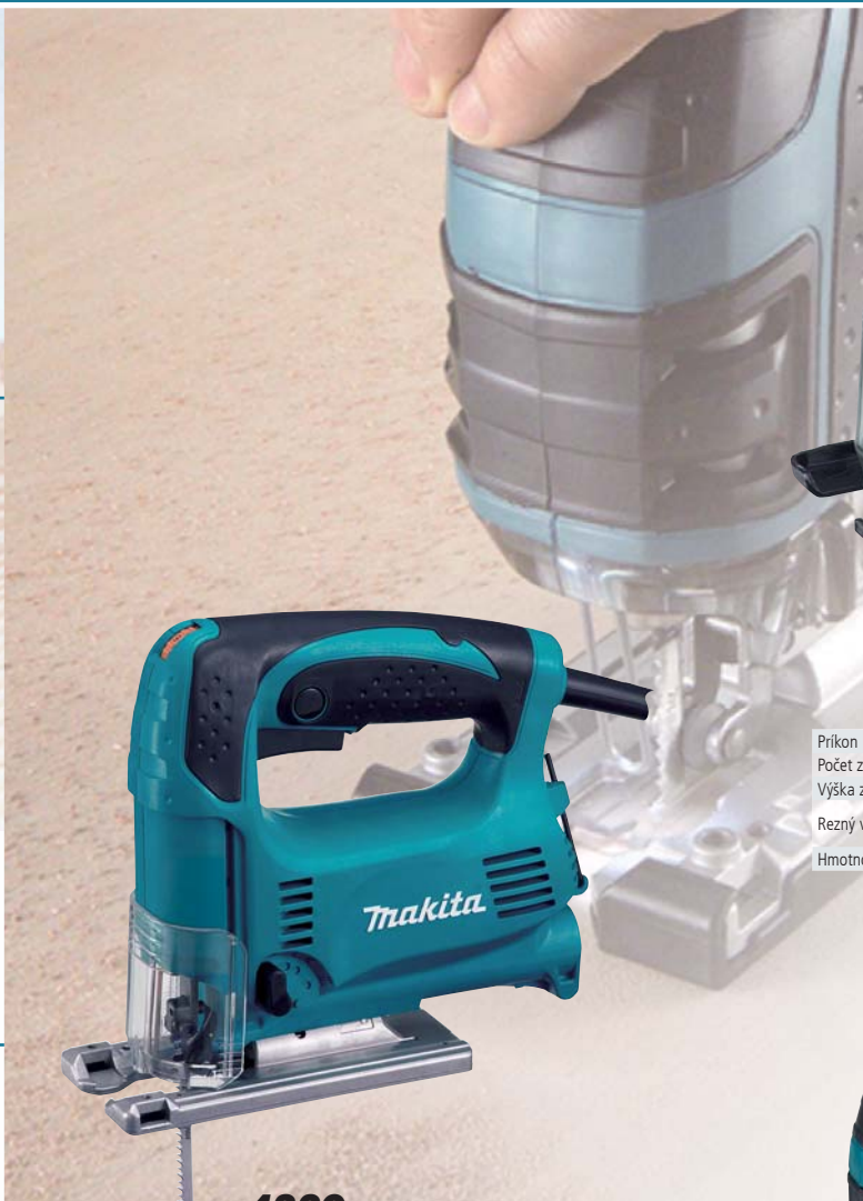
4329 priamočiara píla