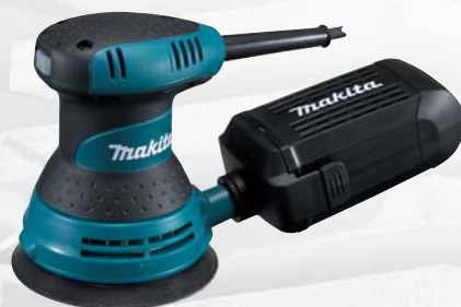
BO5030 excentrická brúska