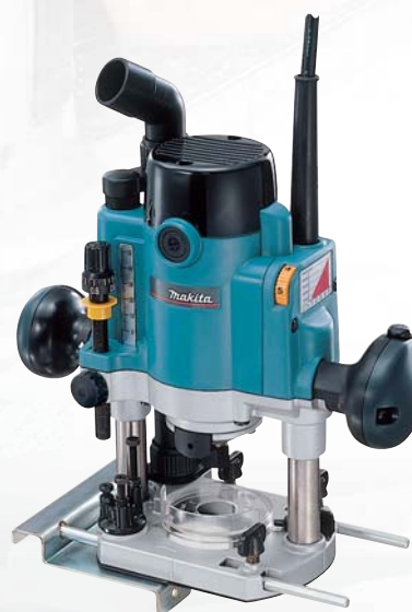
RP110CJ s obmedzovačom rozbehového prúdu pre plynulý štart horná fréza

Dodávané príslušenstvo: prepravný kufor systainer