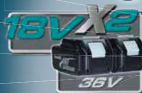
Fukár DUB361 / DUB362

Napájané prostredníctvom dvoch batérií 18 V Li-ion v sériách