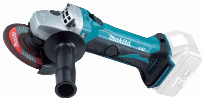
DGA452Z akumulátorová uhlová brúska

Dodávané príslušenstvo: bez akumulátorov, nabíjačky a prepravného kufru