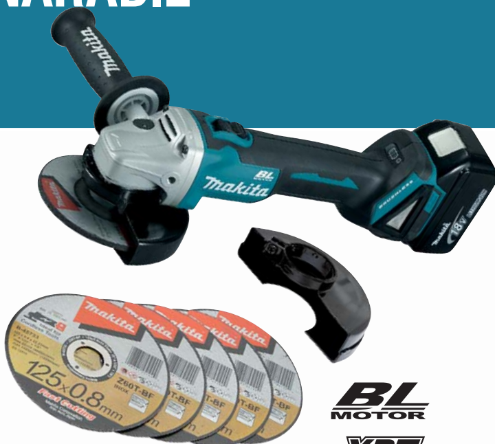
DGA504RTJ1 akumulátorová uhlová brúska

Dodávané príslušenstvo: 2× akumulátor BL1850 (5,0 Ah), nabíjačka, prepravný kufr systainer, 5 ks rezných kotúčov a extra kryt kotúča