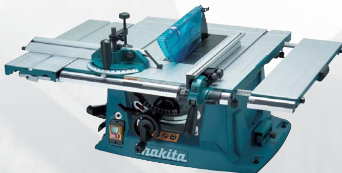
MLT100 okružná píla so stolom