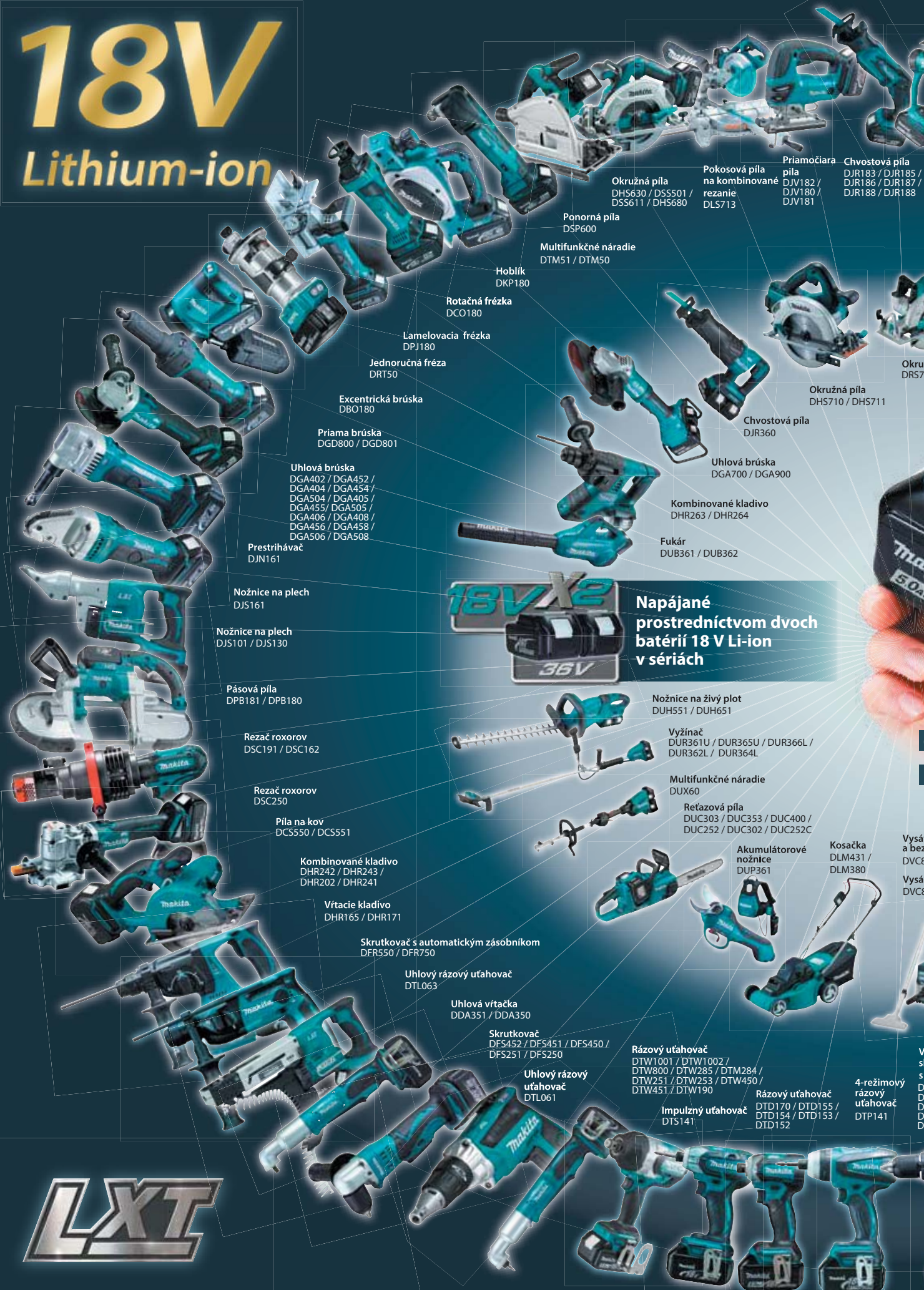
Okružná píla DHS630 / DSS501 / DSS611 / DHS680