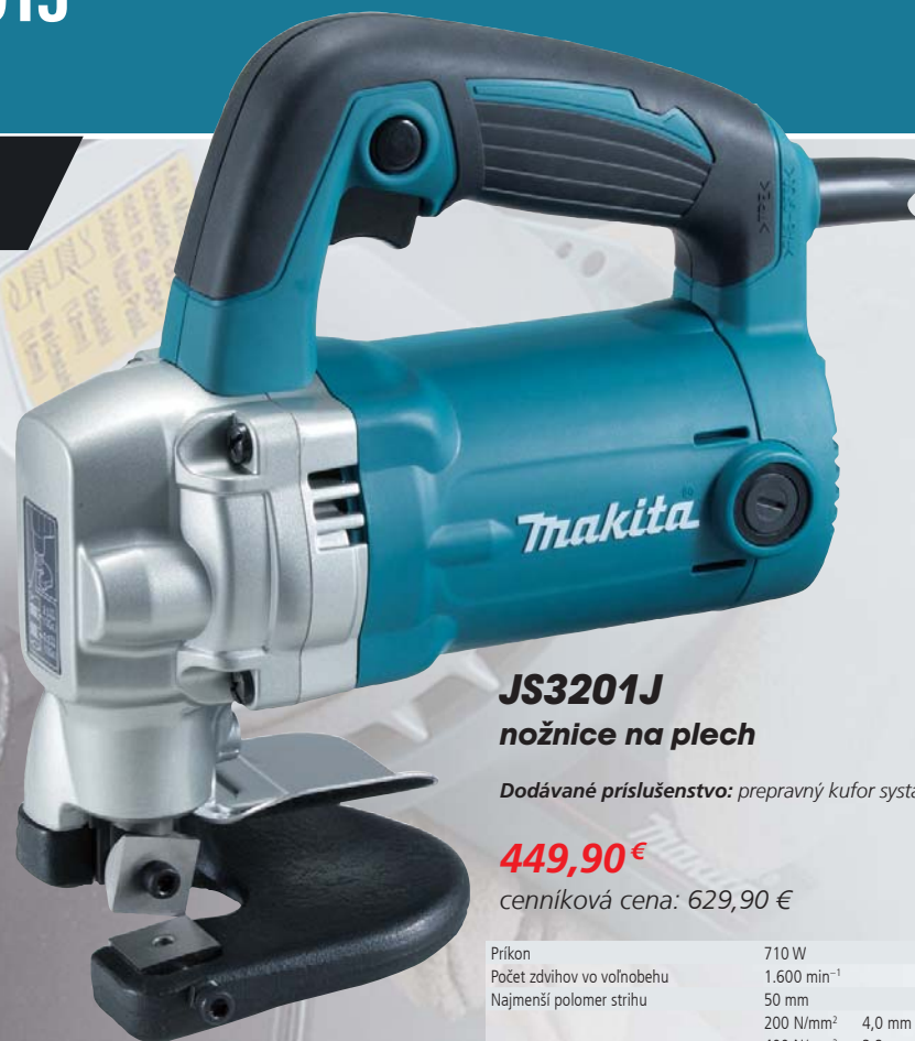
JS3201J nožnice na plech

Dodávané príslušenstvo: prepravný kufor systainer