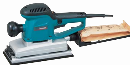
BO4900VJ s variabilným nastavením kmitov vibračná brúska

Dodávané príslušenstvo: prepravný kufor systainer