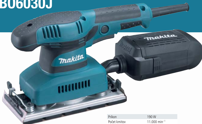
BO3710 vibračná brúska