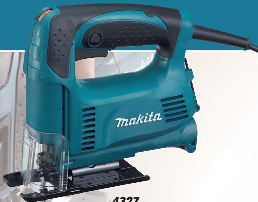
4327 priamočiara píla