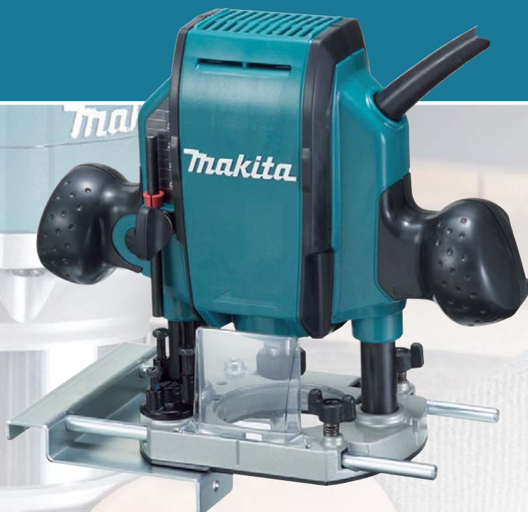
RP0900 horná fréza