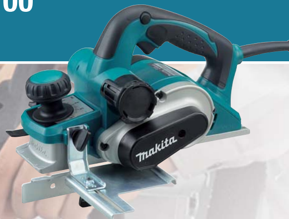
KP0810 falcovací hoblík